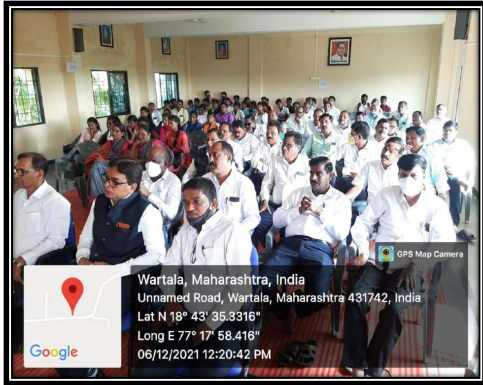
Odiance of the program